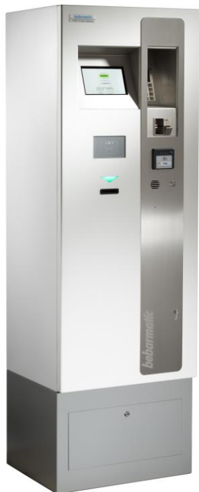
Vorderansicht Kasse Front view cashier